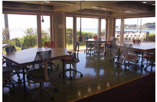
【共有オフィススペース「Open Network Space 鎌倉」】