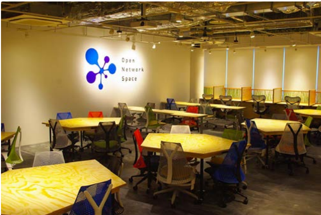
【共有オフィススペース「Open Network Space 代官山」】