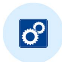
決済用項目の設置